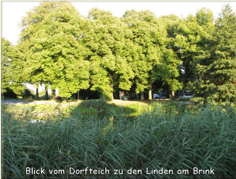
Blick vom Dorfteich zu den Linden am Brink