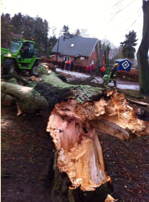
Bild links: Windbruch (bei Windstärke 11) – Stammdurchmesser des Baumes in 1 m Höhe = 245 cm!